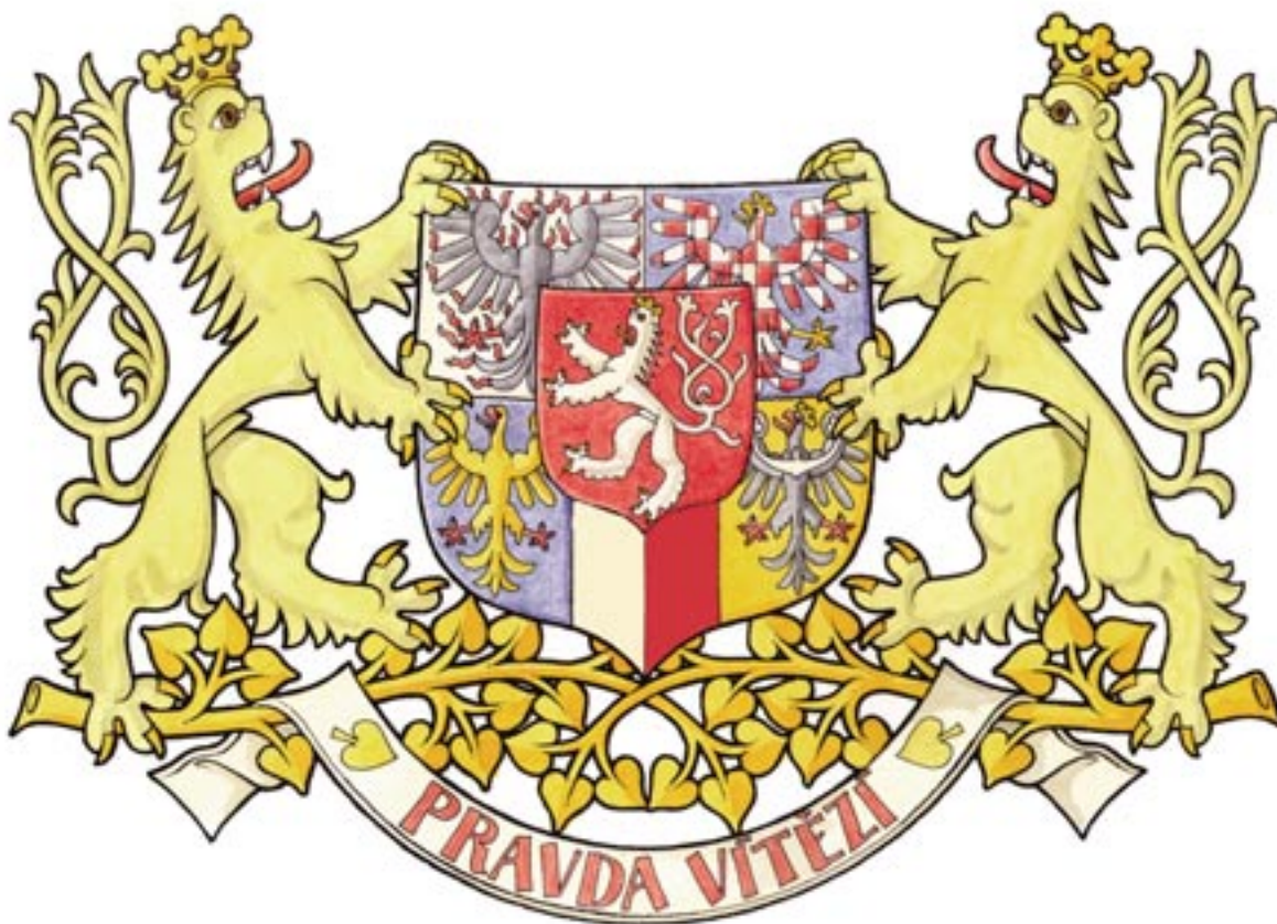
162 a) Varianta teoreticky možné podoby znaku ČR