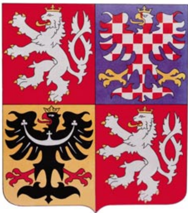
154) Velký znak z roku 1990