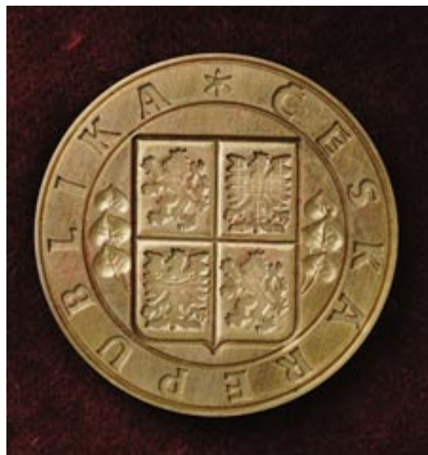
155) Typář státní pečeti. Obráceno zrcadlově.

Během roku 1990 byly v armádě všechny rudé „bojové zástavy“ zrušeny a staženy. V následujících letech dostával každý vojenský prapor individuální podobu, nový jednotný typ se útvarem propůjčuje od května 1999. Má bílo-červenomodrý plaménkový lem, líc připomíná velký státní znak a rub v barvě příslušných baretů obsahuje emblém útvaru.