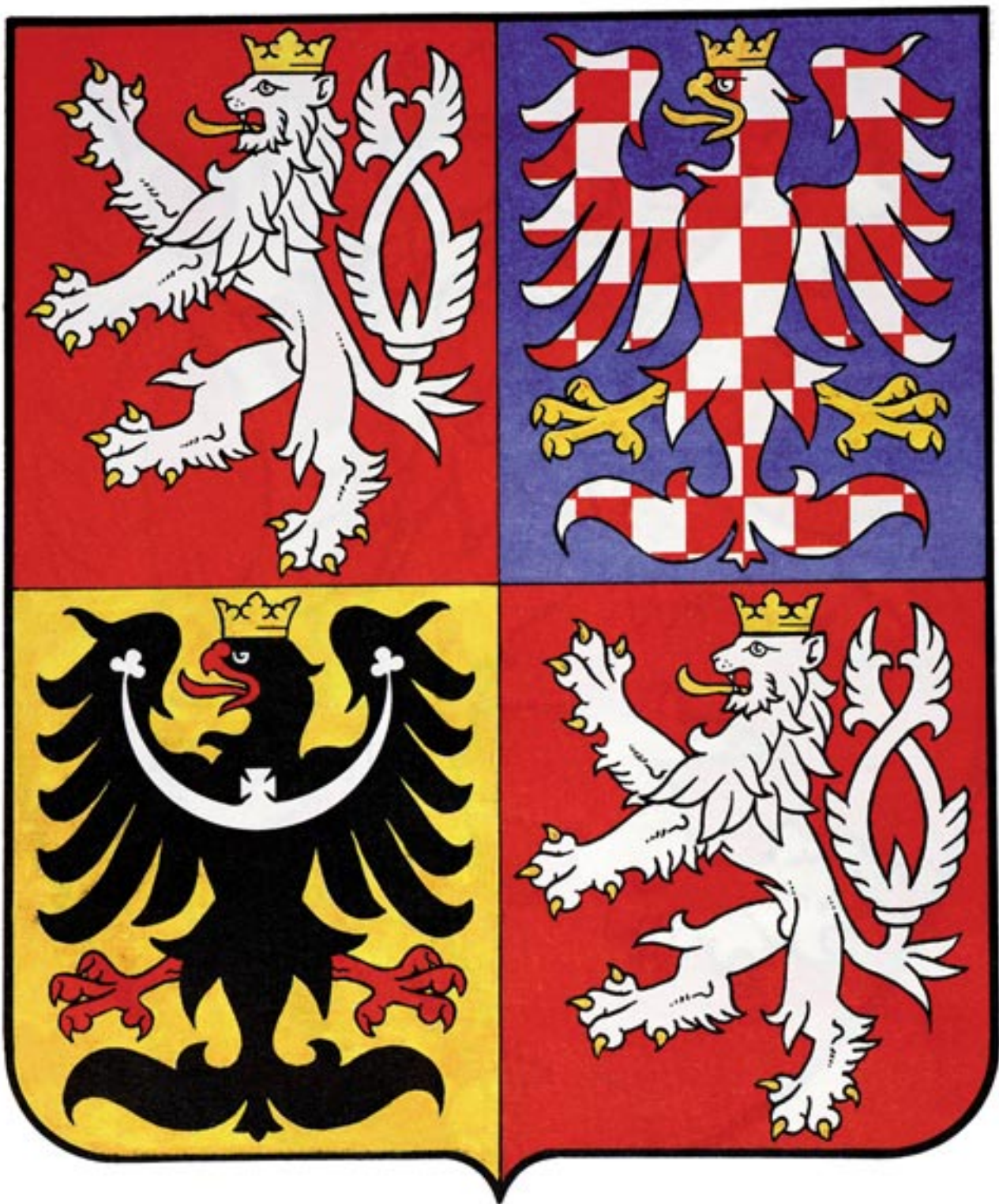
158) Velký znak od roku 1993