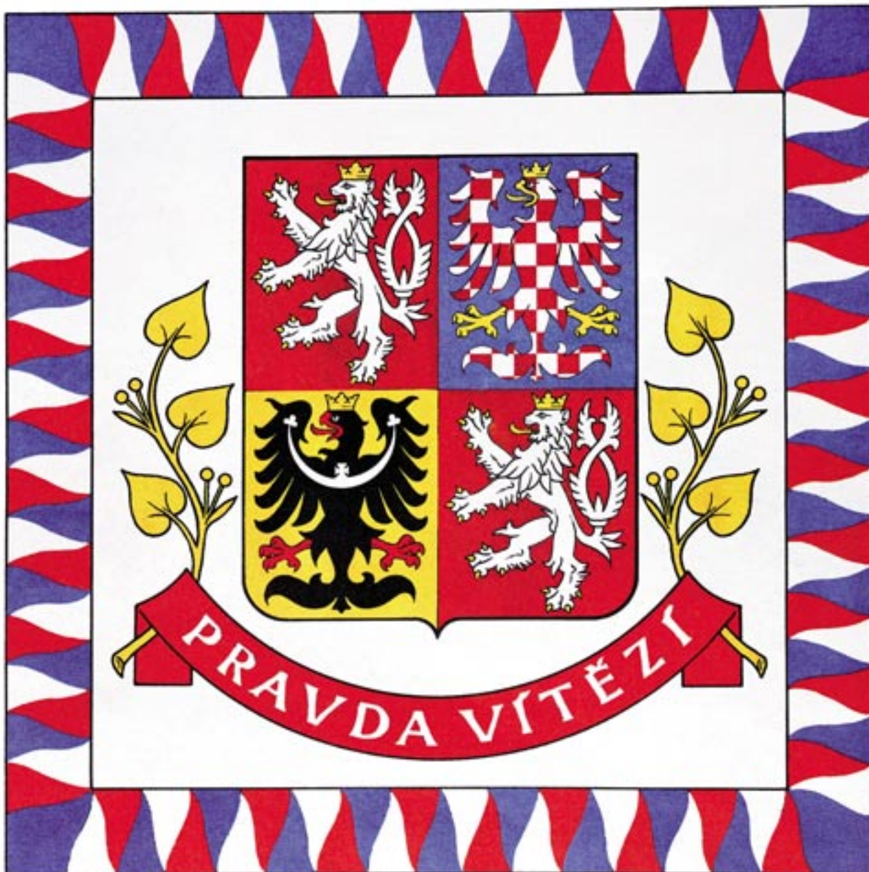
159) Prezidentská vlajka