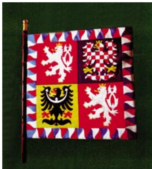
160) Líc vojenského praporu