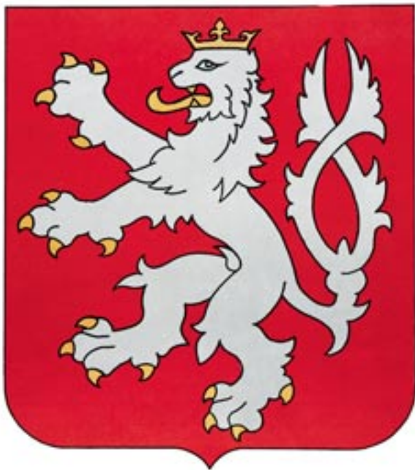
153) Malý znak z roku 1990

Tradiční štít s dvouocasým lvem na začátku roku 1990 zachránila především skutečnost, že byl potřebný do federálního znaku. V důsledku tehdejšího zákona o užívání státní symboliky se s ním lze setkat zejména na razítkách, úředních tiskopisech a mincích, zatímco oficiální barevné provedení bývá vzácností.