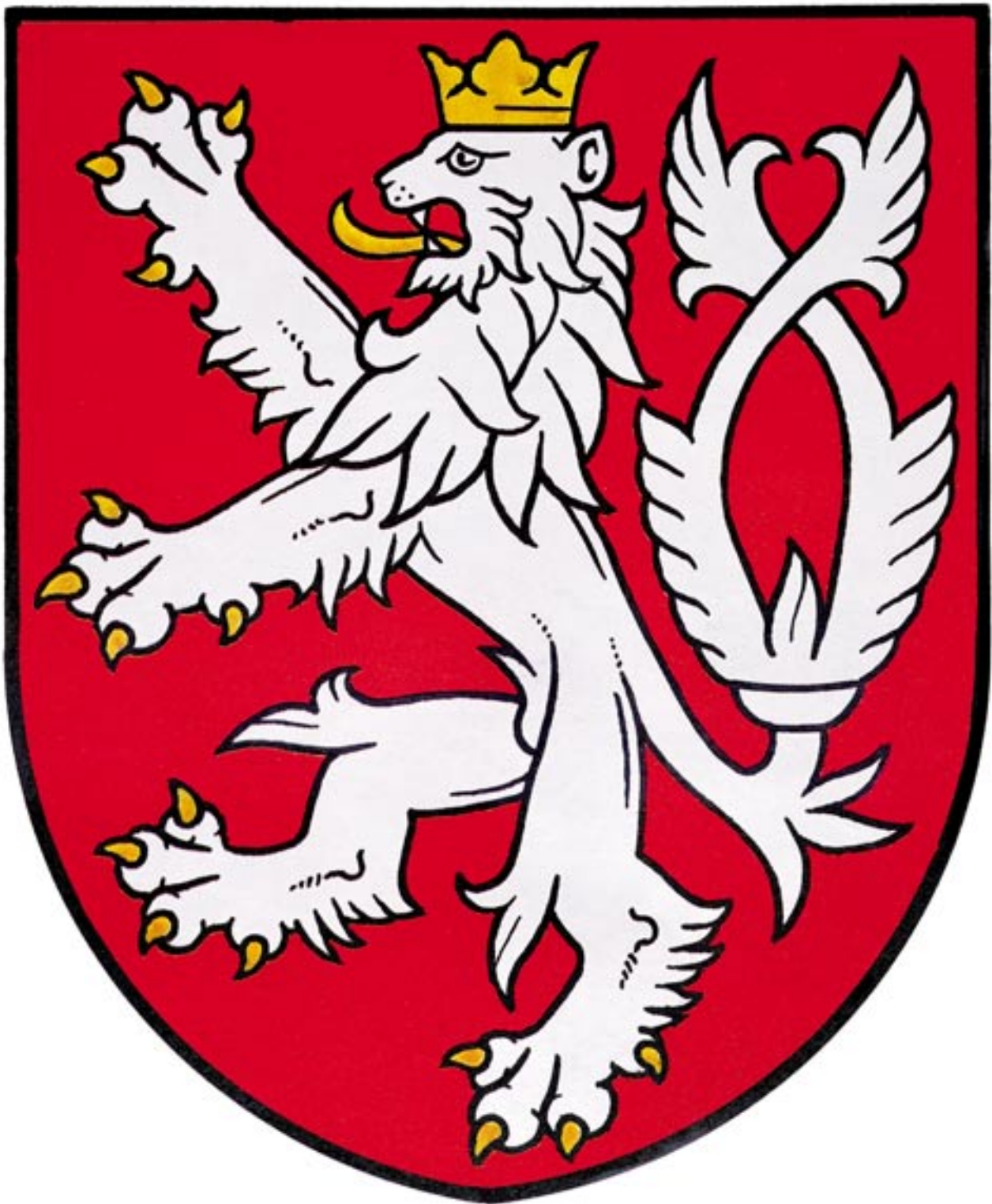
156) Malý znak od roku 1993