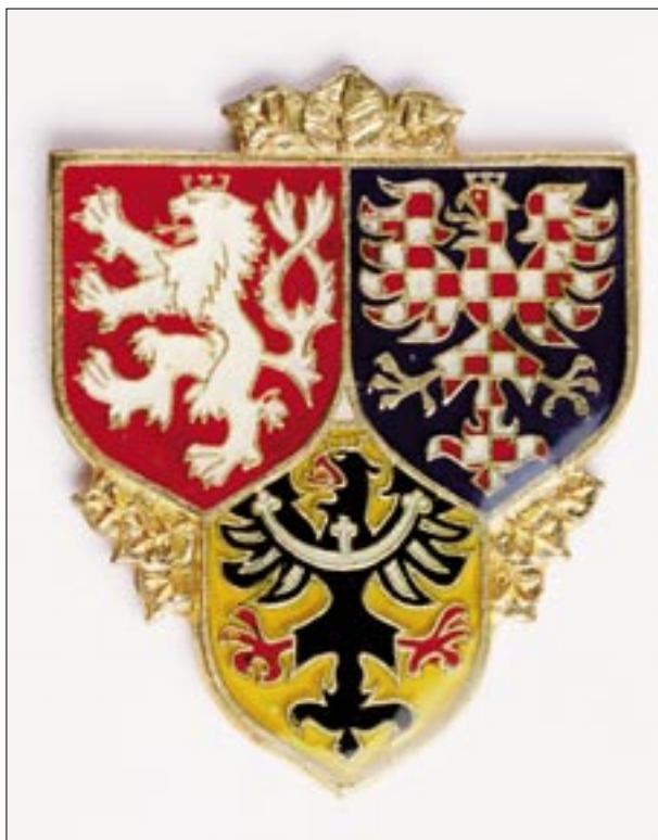
157) Emblém Hradní stráže