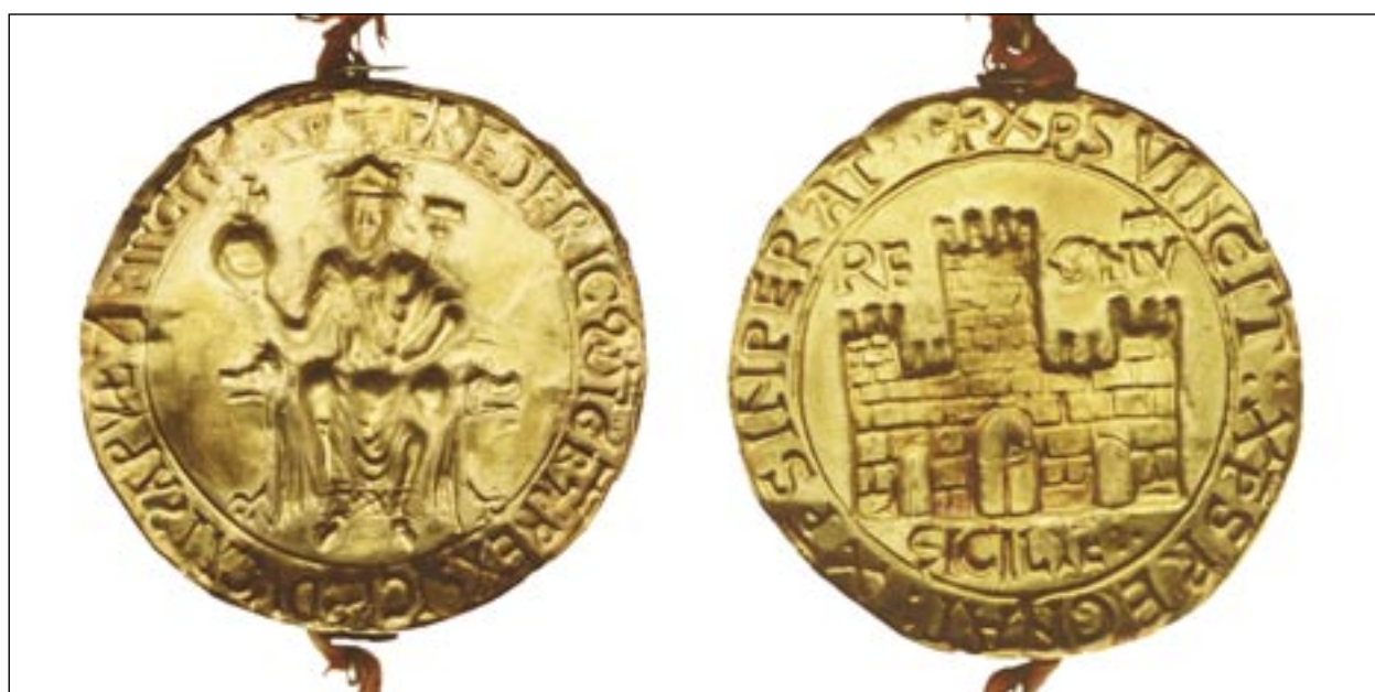
Kat. č. 3 Zlatá bula Fridricha II. jako sicilského krále. Pečeť.