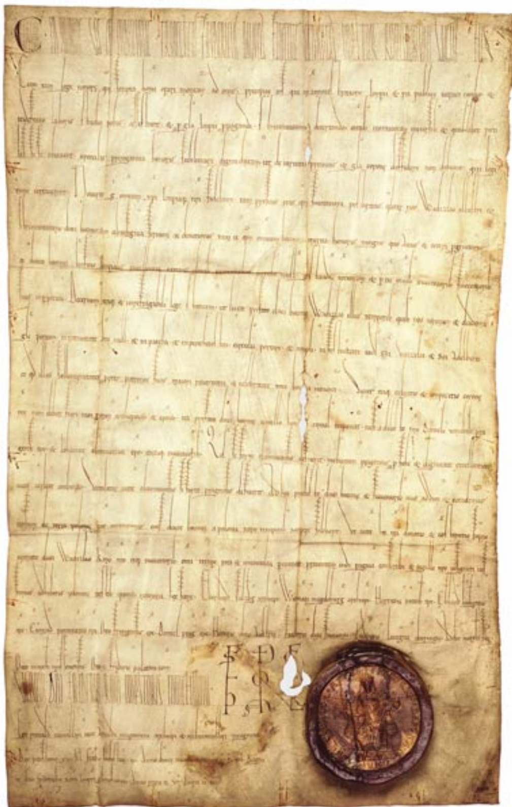
Kat. č. 2 Císař Fridrich I. povoluje vévodovi Vladislavovi nosit o svátcích čelenku, 1158.