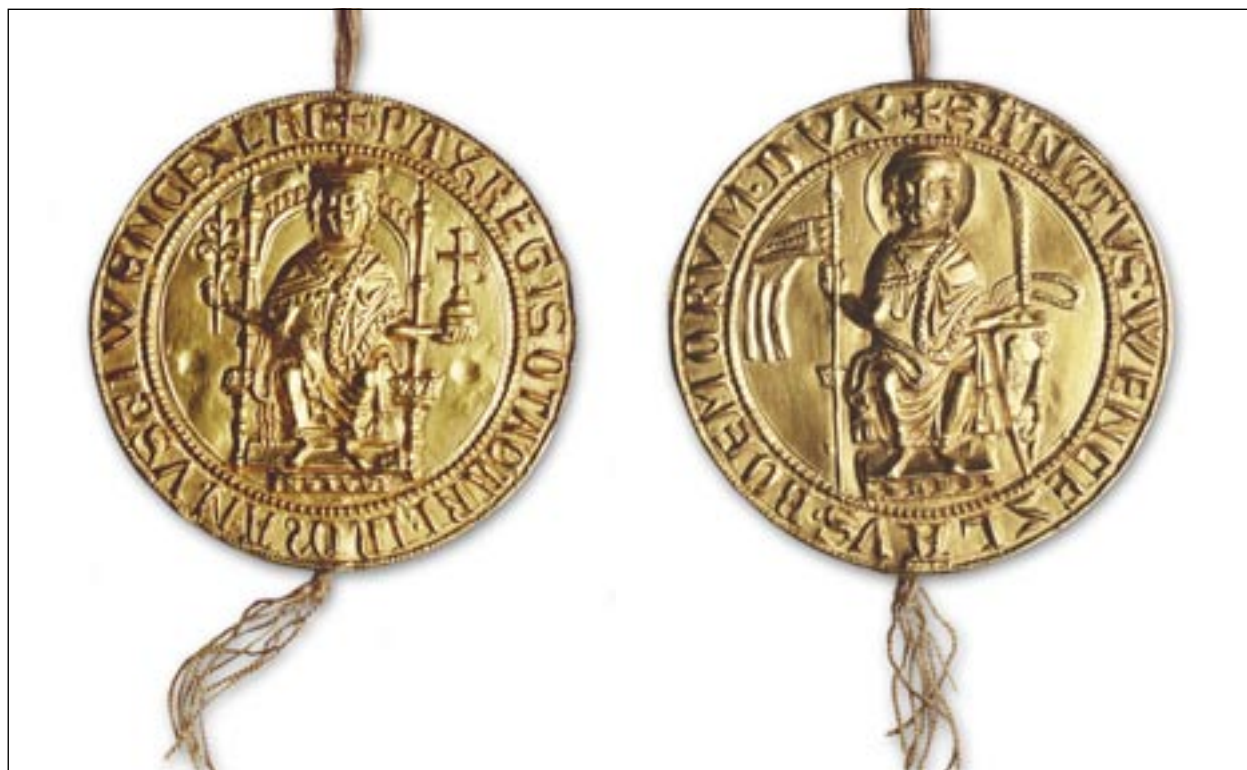
Kat. č. 4 Zlatá bula Přemysla Otakara I., 1224. Avers panovník, revers sv. Václav.

Praha, 1508, orig., latinsky, průměr 93 mm, otisk pečetidla v červeném vosku chráněný miskou. AČK, inv. č. 1860