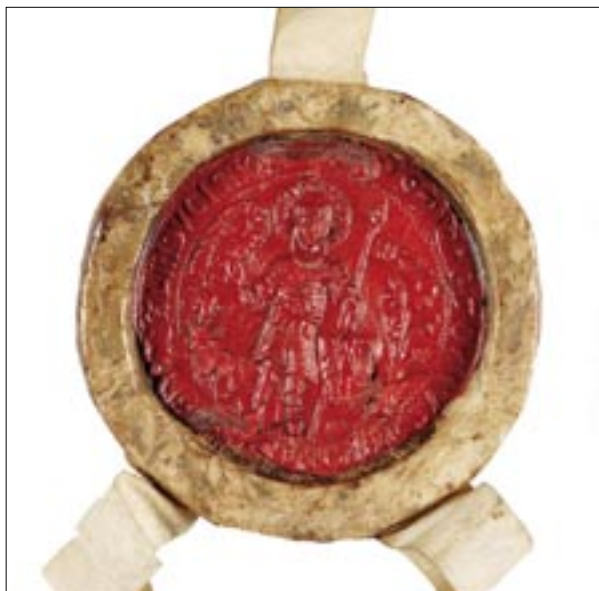
Kat. č. 6 Pečeť zemského soudu Českého království, 1508.

Během druhého desetiletí vlády krále Přemysla Otakara II. (1253 – 1278) se na Pražském hradě konstitoval zemský soud, určený k projednávání záležitostí svobodných obyvatel Českého království, v první řadě šlechticů. Byl považován za nejvýznamnější soudní instituci v zemi a od počátku užíval pečetidlo s vyobrazením svatého Václava, který drží v ruce nápisovou pásku s latinským textem „pohání k soudu“, protože se uplatňovalo především při předvolávání potenciálních provinilců.